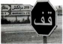
Verkehrszeichen in Marokko. Der Wegweiser (links) ist zweisprachig (arabisch-französisch); das Stoppschild ist so eindeutig, daß es keiner Übersetzung bedarf.

Die führende Rolle des Arabischen als Sprache der heiligen Schrift des Islam und als Sprache einer lange Zeit