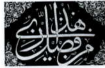
Arabische Schrift: Ornament aus einer Koran-Handschrift.

Manche Wesenszüge sind den semitischen Sprachen gemeinsam. Das gilt zunächst einmal für den Wortschatz. Sieht man von der Verschiedenheit der Schriften ab und stellt gleichbedeutende Wörter des Hebräischen und