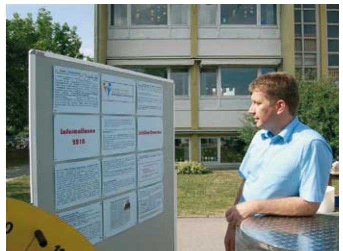
(Die Bilder stammen vom Schulfest 2010 im Marktbergel.) 31.08.2010/pau