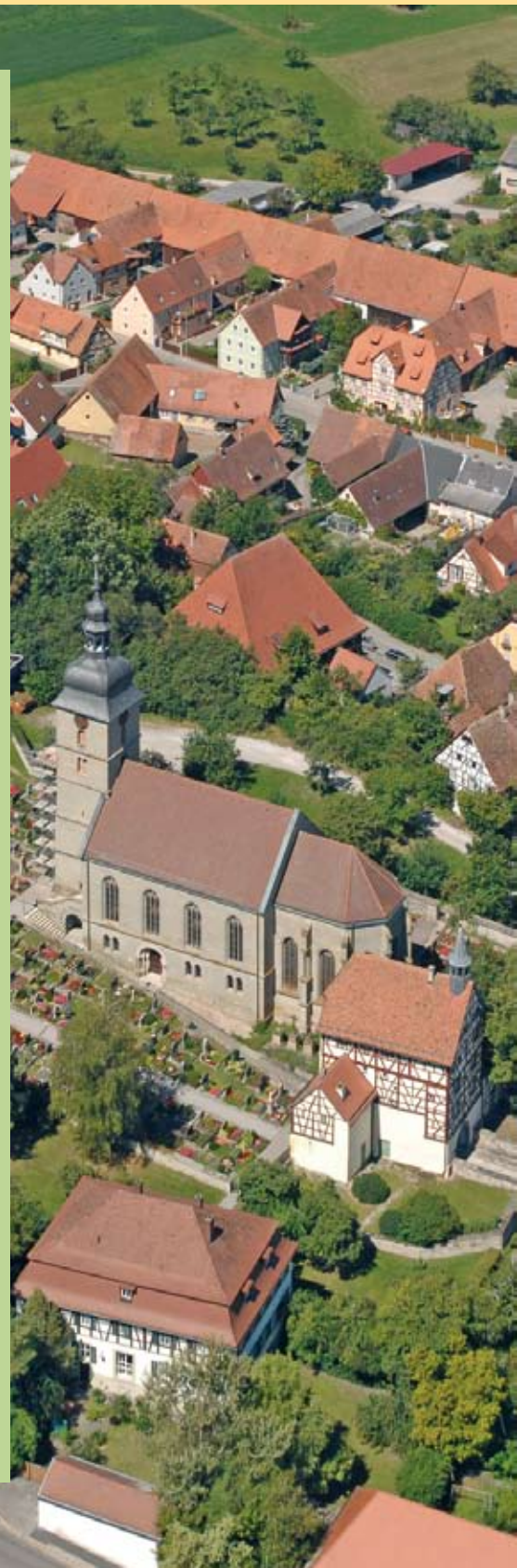
Matthias Schwarz Erster Bürgermeister