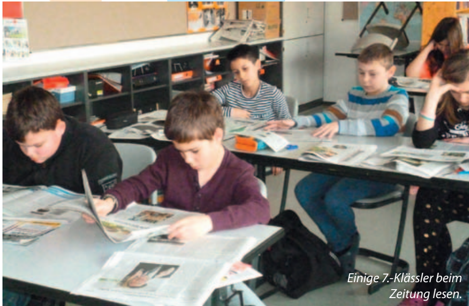
Einige 7.-Klässler beim Zeitung lesen.