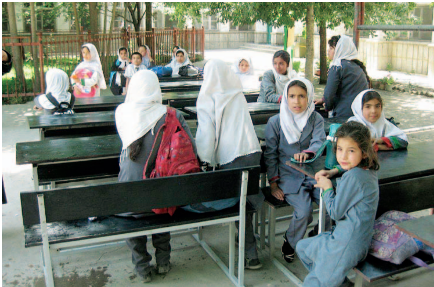
Schülerinnen des Lycée Jamhuriat nehmen ihr neues Mobiliar im Schulhof in Empfang.

unterschiedlicher sozialer Schichten und ethnischer Zugehörigkeit für einen Beruf in der afghanischen Wirtschaft und Verwaltung vorzubereiten.