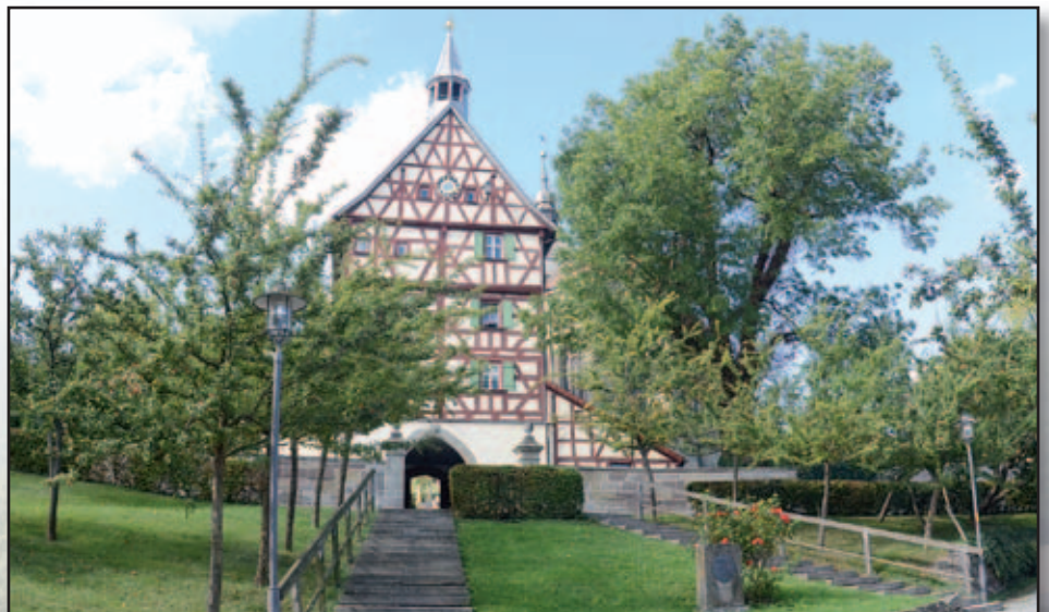
Matthias Schwarz Erster Bürgermeister