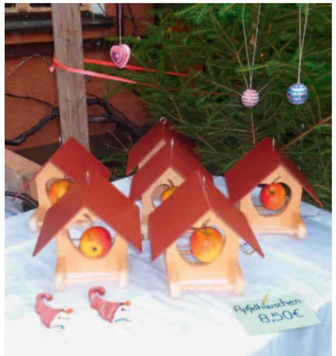
Apfelhäuschen und Pailletten-Weihnachtsschmuck.