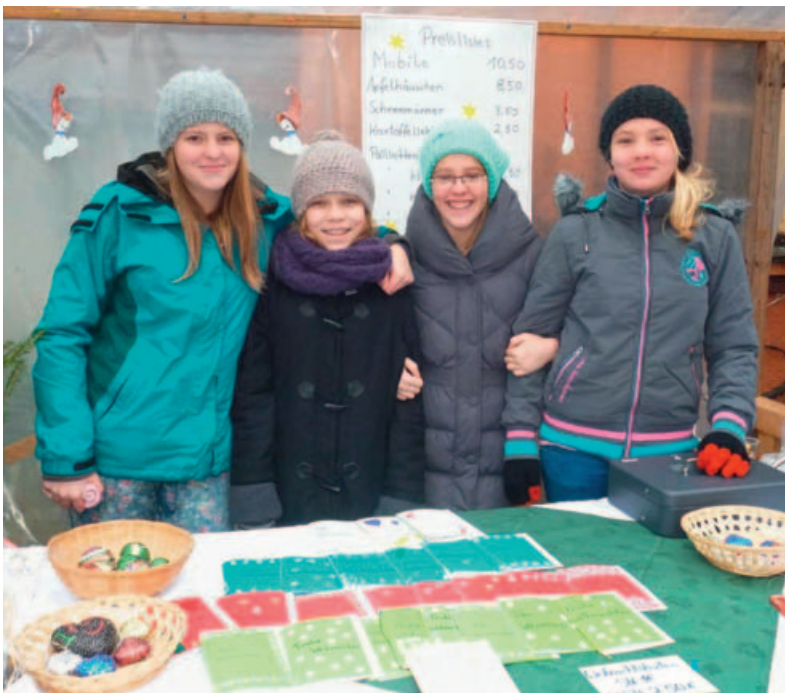
Einige Mädchen als Verkäuferinnen.

karten an. Der Holzstand war mit Unterstützung einiger Eltern schnell zusammengebaut. Dann wurde er dekoriert und die Kunden konnten unsere liebevoll und garantiert in Handarbeit hergestellten Produkte bestaunen und natürlich auch kaufen. Dieses Projekt hat uns einen wertvollen Einblick in das Planen, Produzieren, Verkaufen und Kalkulieren eines Warenangebots verschafft.