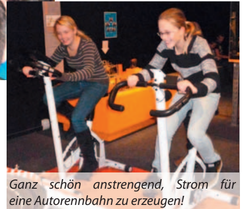
Ganz schön anstrengend, Strom für eine Autorennbahn zu erzeugen!

men im Tier- und Pflanzenreich leicht verständlich präsentiert, um nur einige Beispiele zu nennen. Das war ein interessanter, kurzweiliger und erlebnisreicher Ausflug.